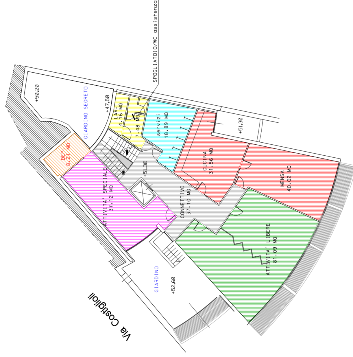
Pianta piano seminterrato 1