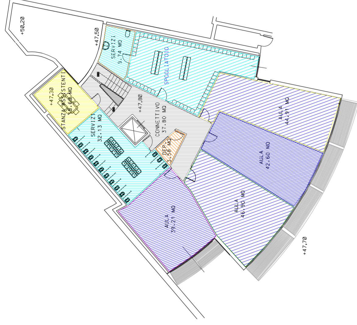
Pianta piano seminterrato 2